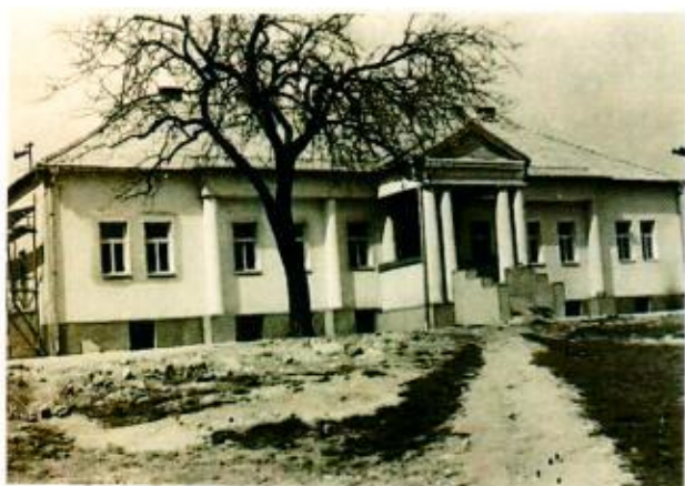
4.7. Pamiatky: Kúria klasicistická z polovice 19. Storočia