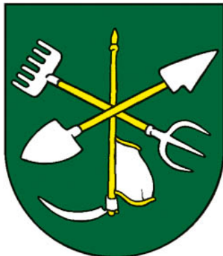
Príloha 1: erb obce